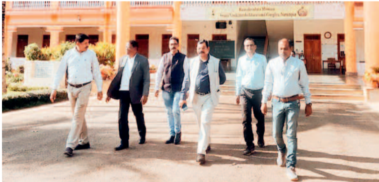
हरिभूमि न्यूज ►► नारायणपुर